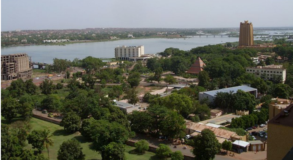
बमाको सिटी, माली, अफ्रिका

चाहन्थे । तर सलिफ सङ्गीत मन पराउँथे । उनी गीत गाउन पाए अरू सबै काम छाडिदिन्थे । यो कुराले उनको परिवार खुसी थिएन । त्यसैले उनी राजधानी बमाको आए । उनले यहाँ धेरै सङ्गीतकारलाई भेटे । गीत लेख्न पनि थाले ।