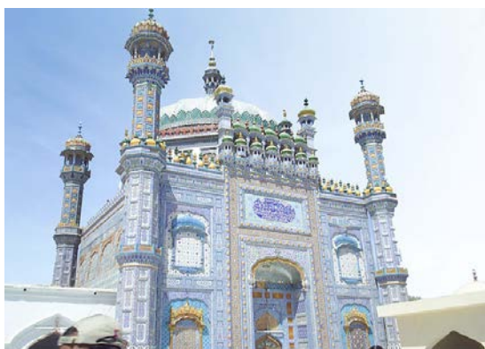
हजरत सचल सरमस्त दरगाह, सिन्ध, पाकिस्तान

आविदालाई उनका बुबाले मातृभाषा सिन्धीमा गाउन सिकाएका थिए । तर, उनी अरू भाषामा पनि गीत गाउँछिन् । उनी उर्दु, हिन्दी, पन्जाबी, सेराइकी र पारसी भाषामा पनि गाउँछिन् । उनी र उनको बुबा पाकिस्तानका दरगाह (धार्मिक स्थलहरू) मा तथा चाडपर्वका बेला गीत गाउँदै अभ्यास गर्थे ।