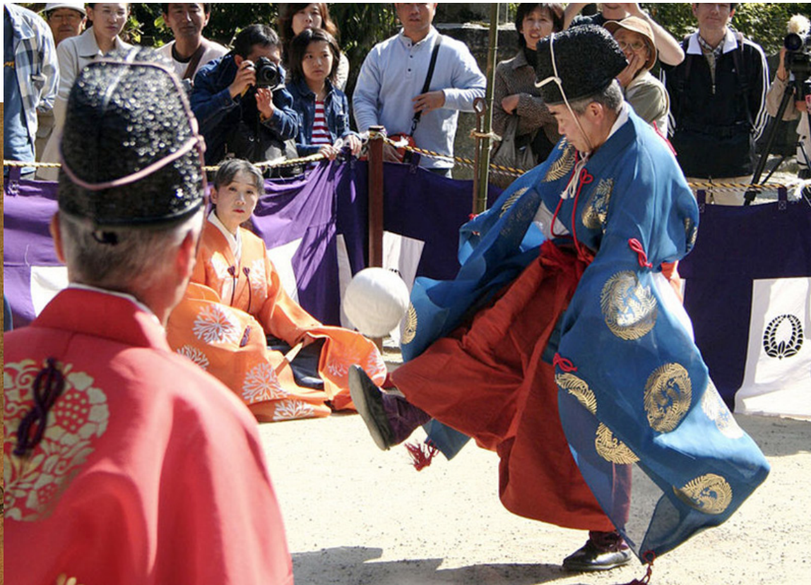
जापानको तान्जान मन्दिरमा केमरी

कुजू पछि जापानमा फैलियो र केमरी भनियो । यो कोरियामा पनि फैलियो, जहाँ यसलाई चुक गुक भनियो ।